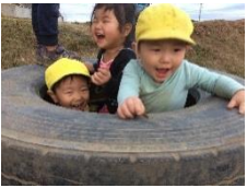
良い場所みつけた！