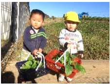
たくさん採れたよ！