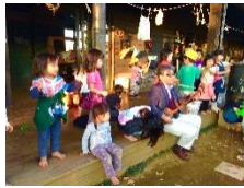
三線って不思議だね！