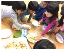
みんなで協力して…