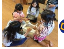
こめとぎスタート！