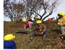
段ボール滑り最高！