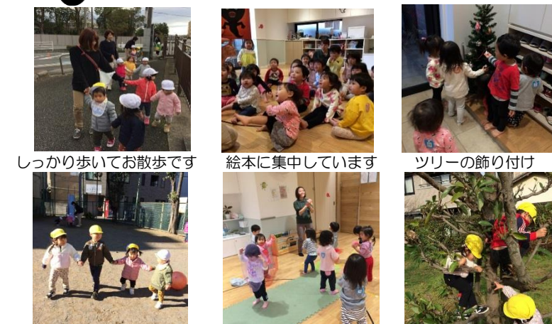
しっかり歩いてお散歩です 絵本に集中しています ツリーの飾り付け あずき組さんが頼もしいです わらべうた遊び 木登り上手でしょ！