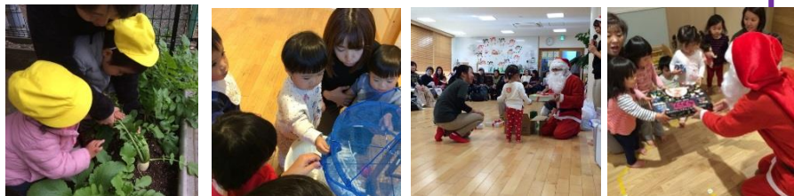
だいこんの収穫 → きりぼし大根作成中！ クリスマス会♪ サンタさんが来てみんな大喜びでした！