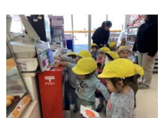
年賀状をポストへ