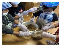
クッキングみそ作り