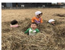
わらのお家ふかふか