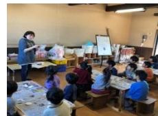
パステルアート体験