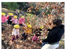
遠足 日高総合公園 ポカポカ陽気でたくさん遊びました