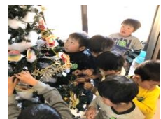
クリスマスツリー飾りつけ