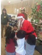
◆みんなで作りました ◆ツリーと一緒に ◆クリスマス製作 ◆クリスマス会