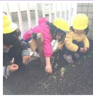
◆チューリップの球根を植えました。 ◆雑草を抜いて、絹さやを植えました。