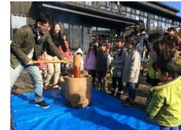
もちつき、べったん！