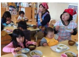
みんなで給食嬉しいな！