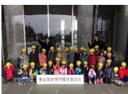
東北歴史博物館に行ったよ