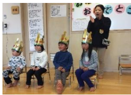
お誕生日、おめでとう！