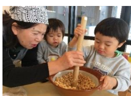
味噌作りをしたよ