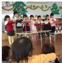
クリスマス会に、サンタさんが来ました