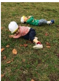
大好きな 芝生カーペット