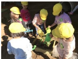
春キャベツを植えました