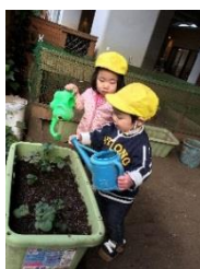
いちごの成長が待ち遠しいです