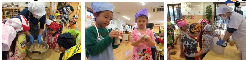
みそは何からできているの？ 大豆を袋に入れてつぶします 美味しいおみそになあれ