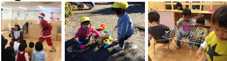
サンタさんがやってきました あわ組：お砂場遊び ひえ組：S字フックかけ