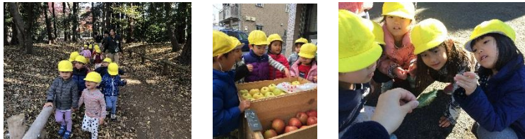
あずき組：井の頭公園へ だいず組：商店街ツアー 幼児組：何の形に見える？