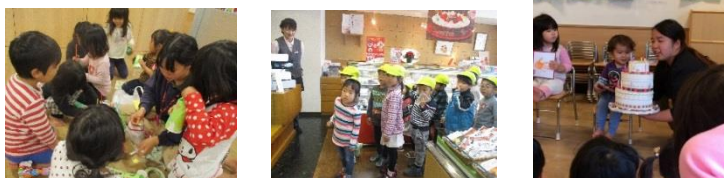
手作り楽器製作(幼児)