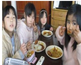
クリスマスメニュー♪