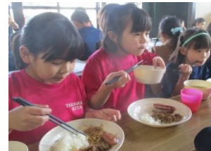
チェリーズでいただきます！