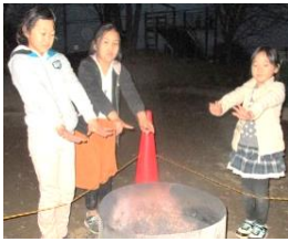
焚き火であつたまろう