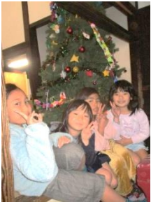
ツリーの前で記念撮影 ☆クリスマスプレゼント