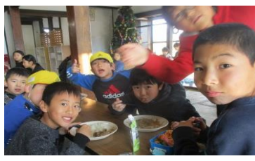
楽しい一年になりますように