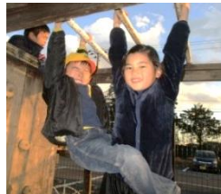
仲良しコンビでうんて