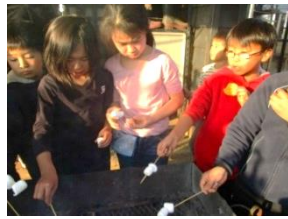
マシュマロ焼いたよ