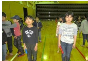
学童スポーツ「位置について～」