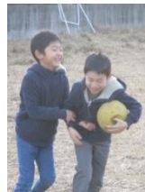
裏グラウンドで ボール遊び