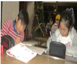
宿題、念入りに・・・